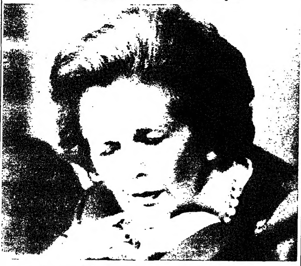
مارغريتا تاتلري، رئيسة وزراء بريطانيا، في جلسة تامل على اثر الانتهاء من مناقشة موضوع انتقال طبقة الاوزون المحيطة بالارض، وذلك في المؤتمر الذي عقد في لندن في ٧ آذار الجاري لندن - ا ف ب